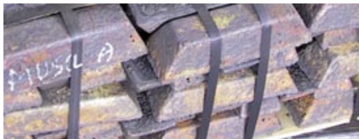
Pani di bronzo