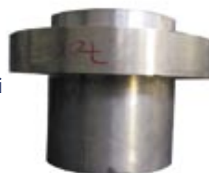
Centrifugato di bronzo flangiato (prelavorazione a disegno)