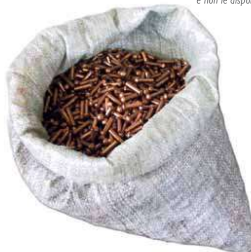
Ribattini di rame.

Le misure, i formati e le leghe riportate nelle tabelle rappresentano gli standard commerciali di produzione, e non le disponibilità di magazzino.